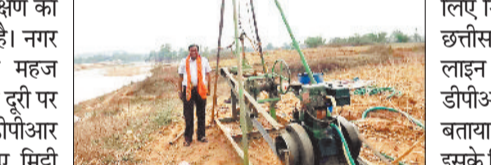
चुका है। जिस प्रकार से भारत सरकार के उपक्रम रेल विभाग द्वारा अम्बिकापुर रेल लाइन के लिए निर्माण के लिए मिट्टी का परीक्षण कराया जा रहा है उसे लोगों में आस जगी है कि जल्द क्षेत्र वासियों को रेल लाइन की सेवा मिलेगी। जिससे क्षेत्र वासियों में खुशी की लहर है।

रामानुजगंज। आजादी के 75 वर्षों के बाद क्षेत्र वासियों को जल्द मिल सकती है रेलवे लाइन की सौगात, ब्रिज निर्माण के लिए मिट्टी परीक्षण का कार्य हो रहा है। नगर की सीमा से महज 500 मीटर की दूरी पर रेलवे द्वारा डीपीआर तैयार करने हेतु ब्रिज निर्माण के लिए मिट्टी परीक्षण का कार्य कराया जा रहा है। जिस प्रकार से तेजी से रेलवे द्वारा रेल लाइन बिछाने की दिशा में कार्य किया जा रहा है। उससे क्षेत्र वासियों में आस जगी है कि जल्द क्षेत्र में रेल लाइन की सौगात मिलेगी। डीपीआर तैयार करने हेतु मिट्टी परीक्षण का कार्य कर रहे कंपनी कर्मचारियों ने