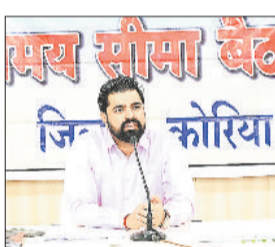
■ तेजी से करें ऑनलाइन एंटी और निराकरण, सीईओ ने दिए निर्देश

उन्होंने बताया कि 8 से 11 अप्रैल तक चले सुशासन तिहार के प्रथम चरण में जिले भर से लगभग 62 हजार आवेदन प्राप्त हुए हैं। इनमें बैकुंठपुर जनपद पंचायत क्षेत्र से 49 हजार, सोनहत से 10,300 तथा नगर पालिका बैकुंठपुर, शिवपुर-चरचा व नगर पंचायत