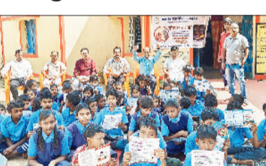
जिन्होंने योग के महत्व पर प्रशिक्षित किया गया, इसके बाद स्वच्छता एवं हस्त प्रच्छालन पर विस्तृत जानकारी दी गई। खासकर भोजन से पहले हाथ

पालन तालाब, पक्का चेक डेम निर्माण, नदीन आगजनाडी भवन, अमृत सरोवर तालाब एवं पौधा तैयारी (नर्सरी) कार्यों का अंतिमोक्षण किया गया। जिले में फील्ड निरीक्षण उपरत जनपद पंचायत मनेन्द्रगढ़ के सभाकक्ष में सर्वे मुख्य कार्यपालन अधिकारी जनपद पंचायत, अनुविभागीय अधिकारी (आरईएस), महात्मा गांधी नरेगा एवं प्रधानमंत्री आवास की जिला पंचायत एवं जनपद की पूरी टीम के साथ समीक्षा बैठक लेकर योजनाओं में प्रगति लाते हुए योजना के बेहतर क्रियान्वयन के संबंध में आवश्यक मार्गदर्शन एवं आजीविका विकास गतिविधियों से मनरेगा को जोड़ने सतत निर्देश दिए गए।