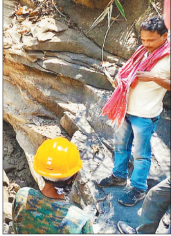
कार्रवाई करती टीम।

कोरिया जिले के पटना क्षेत्र अंतर्गत जामघाट में लंबे समय से संचालित एक अवैध कोयला सुरंग को वन विभाग और साउथ ईस्टर्न कोलफील्ड्स लिमिटेड की संयुक्त कार्रवाई के तहत ब्लास्ट कर ध्वस्त कर दिया गया। इस सख्त कदम से अवैध खनन माफियाओं में हड़कंप मच गया है। वन मंडलाधिकारी कोरिया श्रीमती प्रभाकर खलखो ने बताया कि जामघाट क्षेत्र में अवैध खनन की लगातार शिकायतें मिल रही थीं। निरीक्षण में सुरंग की पुष्टि होने के बाद उच्चाधिकारियों के निर्देश पर तत्काल कार्रवाई की गई। सुरंग को विस्फोटक सामग्री से पूरी तरह बंद कर दिया गया, जिससे भविष्य में यहां दोबारा कोई गतिविधि न हो सके। कार्रवाई के दौरान वन विभाग के साथ पुलिस, खनिज विभाग, एसईसीएल के तकनीकी विशेषज्ञ, सुरक्षाकर्मी तथा स्थानीय प्रशासन के अधिकारी मौजूद रहे। प्रशासन ने सुरक्षा के सभी मानकों का पालन करते हुए क्षेत्र को चारों ओर से सील किया और आसपास के ग्रामीणों को अस्थायी रूप से सुरक्षित स्थानों पर हटाया गया। डीएफओ श्रीमती खलखो