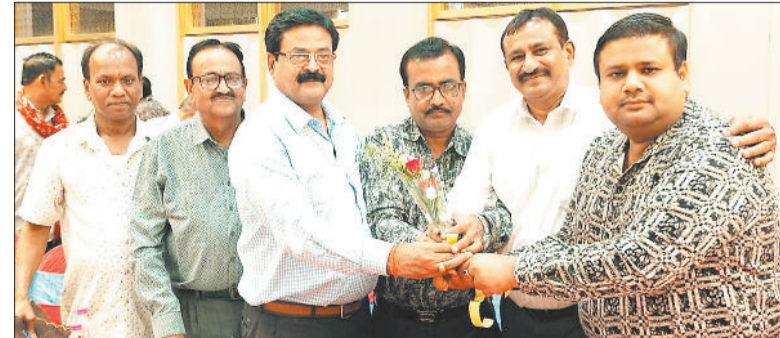
नए अध्यक्ष को शुभकामनाएं देते समाज के लोग

नया परिषद द्वारा अप्रैल माह की शुरुआत होने के साथ ही शहर के तीन जगहों पर सार्वजनिक प्याउ खोला गया, वहीं शहर के जिन जगहों पर लोगों की सबसे ज्यादा आवाजाही रहती है, उन जगहों पर अब तक सार्वजनिक प्याउ नहीं खुल पाया है, उन्हीं जगहों में व्यस्त क्षेत्र बस स्टैंड भी शामिल है। जानकारी के अनुसार शहर के न तो पुराने बस स्टैंड पर नया प्याउ खोला गया है और न ही न्यू प्रतीक्षा बस स्टैंड पर ही प्याउ की सुविधा दी गई, जबकि प्रतीक्षा बस स्टैंड पर काफी संख्या में लोगों की आवाजाही रहती है, वहीं पास में ही तहसील कार्यालय है। ऐसे जगह पर प्याउ की सबसे ज्यादा जरूरत है, लेकिन इन जगहों पर प्याउ खोलने में नया प्रशासन अब तक ध्यान नहीं दे रहा है।